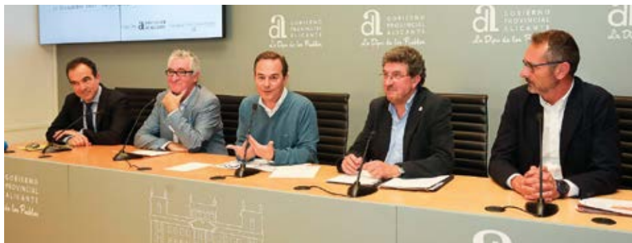
Rueda de prensa en Diputación, Presentación "Música por sonrisas".

directo el agradecimiento del público, de los responsables de Nazaret y de nuestro coro. Pero de justicia es reiterarlo en estas líneas del Periscopio para que perdure y para que los nombres de todos queden unidos en los anales de nuestra Asociación.