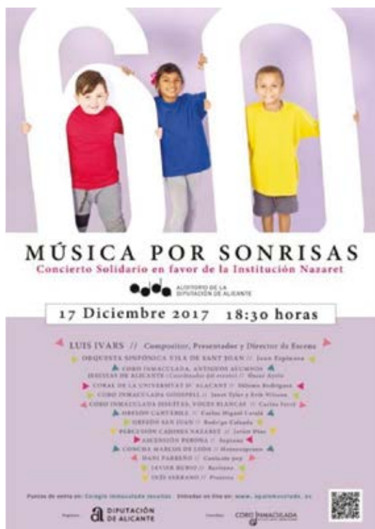
Cartel "Música por sonrisas, 60 Aniversario Nazaret"

Decíamos en el Periscopio del año pasado que a finales del 2017 el coro quería llenar el ADDA con un acto conmemorativo del sesenta aniversario de Nazaret. Una actuación que, cuando se expresaban aquellos deseos, no tenía nombre, ni mensaje, ni intervinientes, ni contenido, ni siquiera fecha cierta.